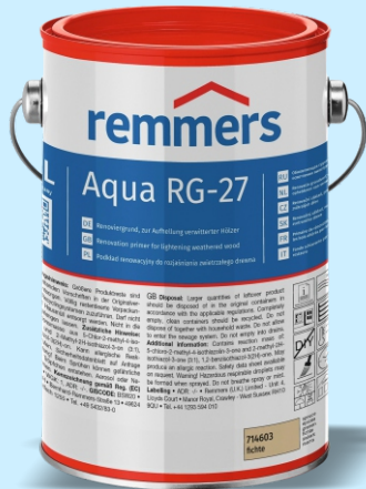
2,5 L - art. br. 7146