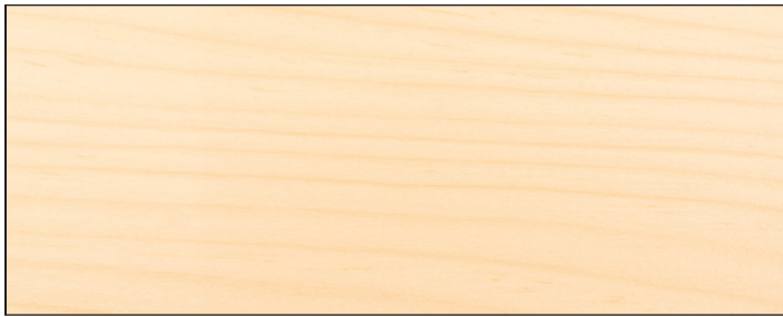
Muster zeigt Aqua MSL-45 farblos UV+/ Sample shows Aqua MSL-45 clear UV+

Im Gegensatz zu herkömmlichen Lasuren, die häufig bereits beim Auftragen vergilben, bleibt das Ergebnis mit Aqua MSL-45/sm UV+ hell und gleichmäßig.