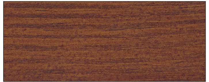
Muster zeigt Aqua MSL-45 UV+ nussbaum (RC-660)/ Sample shows Aqua MSL-45 UV+ nutwood (RC-660)

Dank des hohen UV-Schutzes sind längere Wartungsintervalle für alle Lasurfarbtöne möglich. Farblos UV+ kann zudem als Opferschicht auf mit Aqua MSL-45/sm behandelten Flächen verwendet werden und verhindert bei rechtzeitiger Pflege eine unerwünschte Verdunklung der Oberfläche.