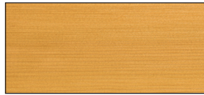
eiche hell (RC-365)