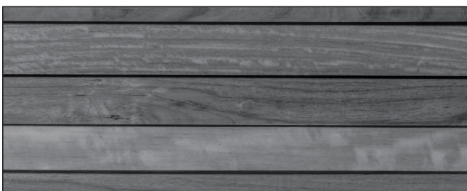
anthrazitgrau intensiv ▪ anthracite grey intense Art.-No. 2599