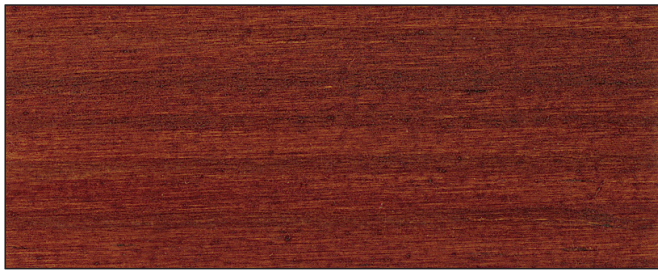
teak ▪ teak Art.-No. 2653