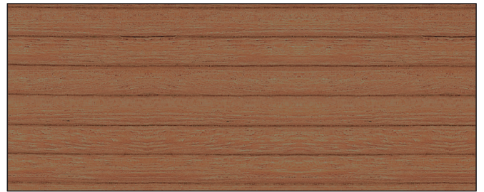
bangkirai ▪ bangkirai Art.-No. 2655