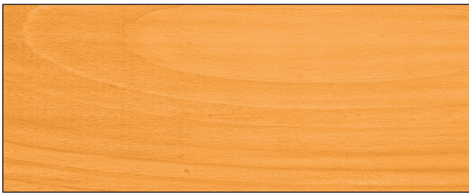
lärche ▪ larch Art.-No. 2654