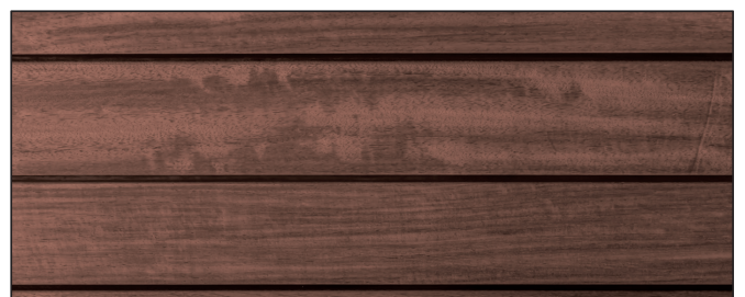
bangkirai intensiv ▪ bangkirai intense Art.-No. 2598